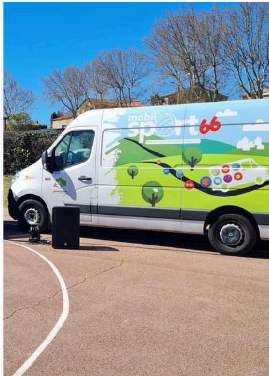
À droite : Un des deux camions de Mobil'Sport dans les Pyrénées-Orientales.